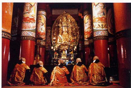
位於壇上伽藍的根本大塔，是作為真言密教主道場而建的。主佛是胎藏大日如來和金剛界的4佛，16根柱子上描繪著16大菩薩像。

靈地「高野」由816年作為真言密教修禪的道場由空海創建的「金剛峰寺」、在山下建造的「慈尊院」、官省符莊的鎮守社「丹生官省符神社」、以及位於金剛峰寺和慈尊院之間、與金剛峰寺有密切關係的「丹生都比賣神社」組成。高野山是有約1200年信仰山歷史的山上宗教都市，形成了與寺院和樹林融為一體的宗教信仰有關的文化景觀。