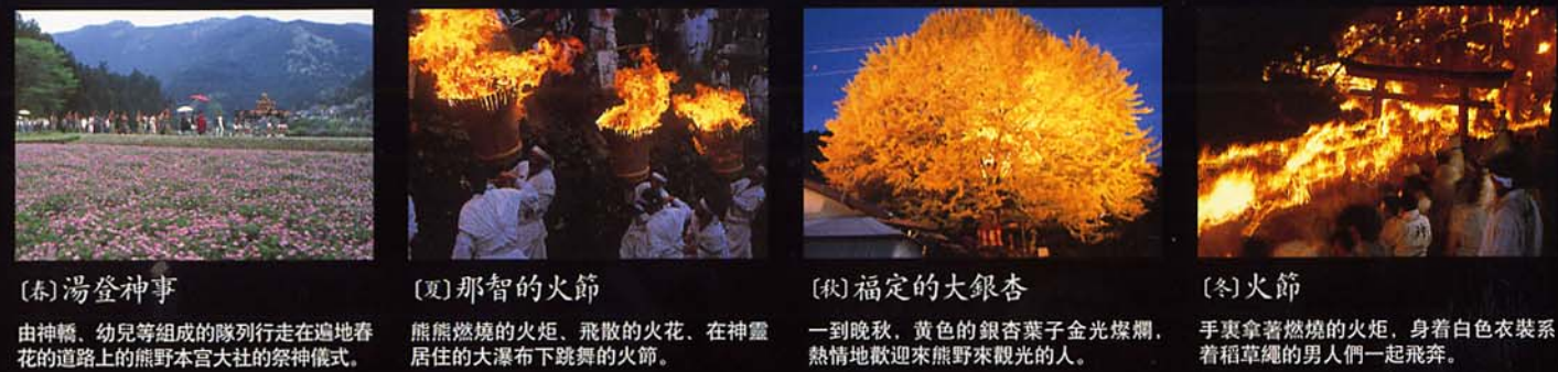
(春) 湯登神事 由神轎、幼兒等組成的隊列行走在遍地春花的道路上的熊野本宮大社的祭神儀式。 (夏) 那智的火節 熊熊燃燒的火炬、飛散的火花，在神靈居住的大瀑布下跳舞的火節。 (秋) 福定的大銀杏 一到晚秋，黃色的銀杏葉子金光燦爛，熱情地歡迎來熊野來觀光的人。 (冬) 火節 手裏拿著燃燒的火炬，身著白色衣裝系著稻草繩的男人們一起飛奔。