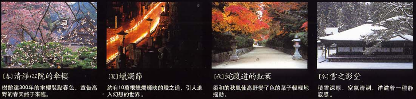
(春) 清淨心院的傘櫻 樹齡達300年的傘櫻裝點春色，宣告高野的春天終於來臨。 (夏) 蠟燭節 約有10萬根蠟燭輝映的燈之道，引人進入幻想的世界。 (秋) 蛇腹道的紅葉 柔和的秋風使高野變了色的葉子輕輕地搖動。 (冬) 雪之影堂 積雪深厚，空氣清冽，洋溢著一種靜寂感。